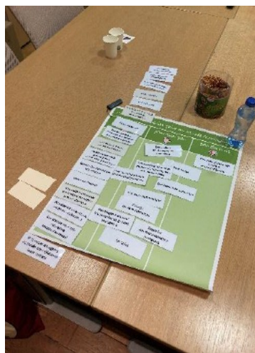
Figure 3: L'activité "tri de cartes" pendant le focus-groupe étudiants

L'activité « tri de cartes » a également été utilisée pour ce focus-groupe. Nous avons pour cela divisé le groupe en deux sous-groupes, ce qui a permis à chacun de donner son avis plus librement dans une configuration plus conviviale.