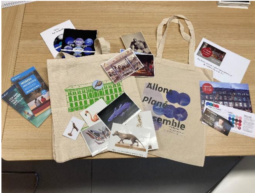
Figure 1: Les contreparties remises aux participants aux focus-groupes

Strasbourg et Jardin des Sciences). Toutes ont été particulièrement appréciées par les participants 11 .