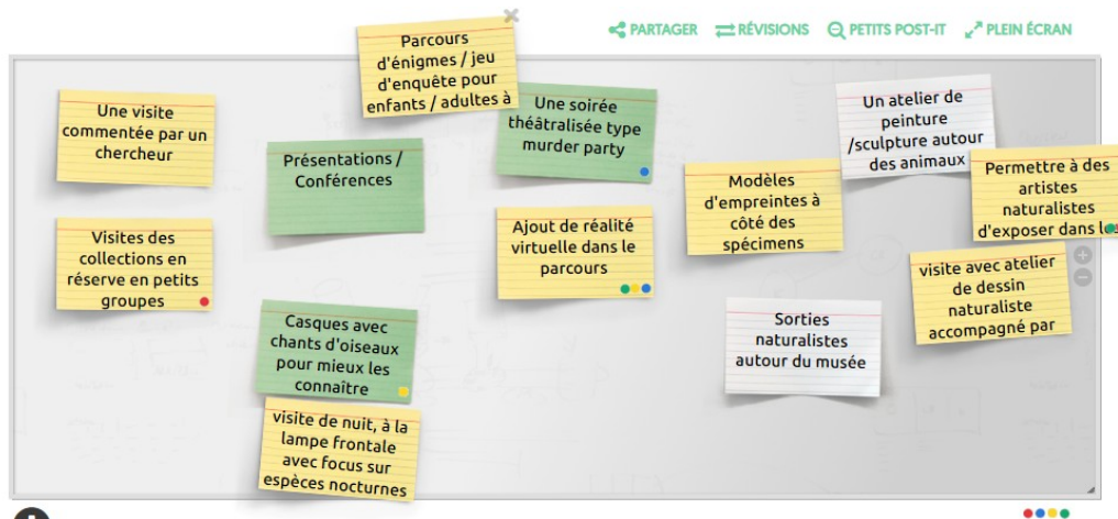
Figure 2: Mur de post-its du focus-groupe "spécialistes", avec l'outil de post-its en ligne Colibri ( https://postit.colibris-outilslibres.org )

L'implication et les connaissances des participants liées aux sciences du vivant a justifié de les réunir autour de ce statut de « spécialistes », bien qu'ils n'adhèrent pas forcément au terme, auquel ils préfèrent celui « d'enthousiastes ». Pour Participant B-7, cette implication particulière fait surtout d'eux des « super-motivés ».