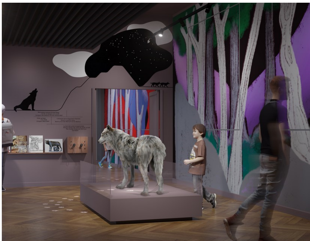
Figure 4: Vue de la future salle totem du "loup" au Musée Zoologique de Strasbourg, copyright : Oneblock.city pour Ducks Sceno / Freaks

De la même manière, la perception du loup comme animal emblématique se confirme lors du focus-groupe L'Arche, où les participants expriment une forte réaction d'amusement et d'enthousiasme en découvrant l'image de la future salle totem du loup.